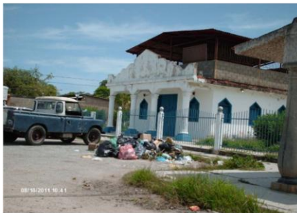
5. Punto de recolección de aseo urbano (LV)