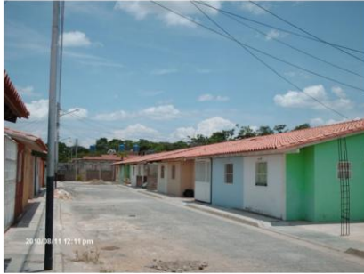
1. Vialidad interna de EGM