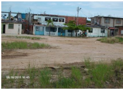
3. Plaza Central de LV