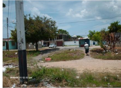
2. Espacio público de EGM y frontera con LV