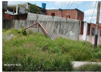
4. Área Recreativa de LV