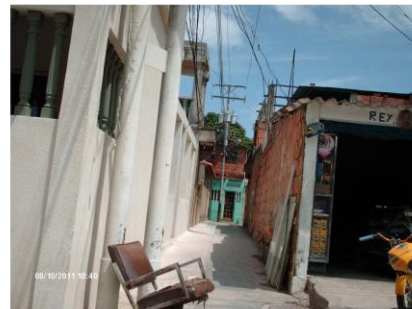
6. Sistema de veredas peatonales (LV)