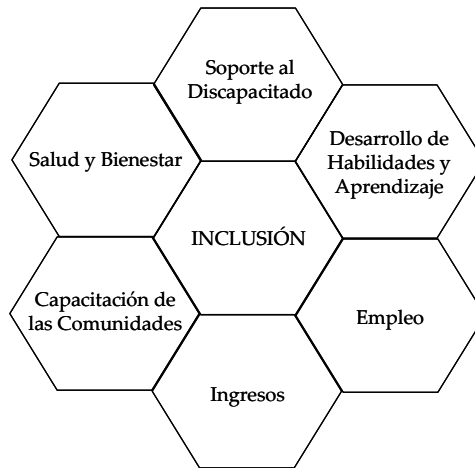
Figura 1. Esquema general sobre los aspectos fundamentales asociados a la inclusión (visión del gobierno canadiense expresada en el Programa “Avanzando hacia la Inclusión”) (2004)