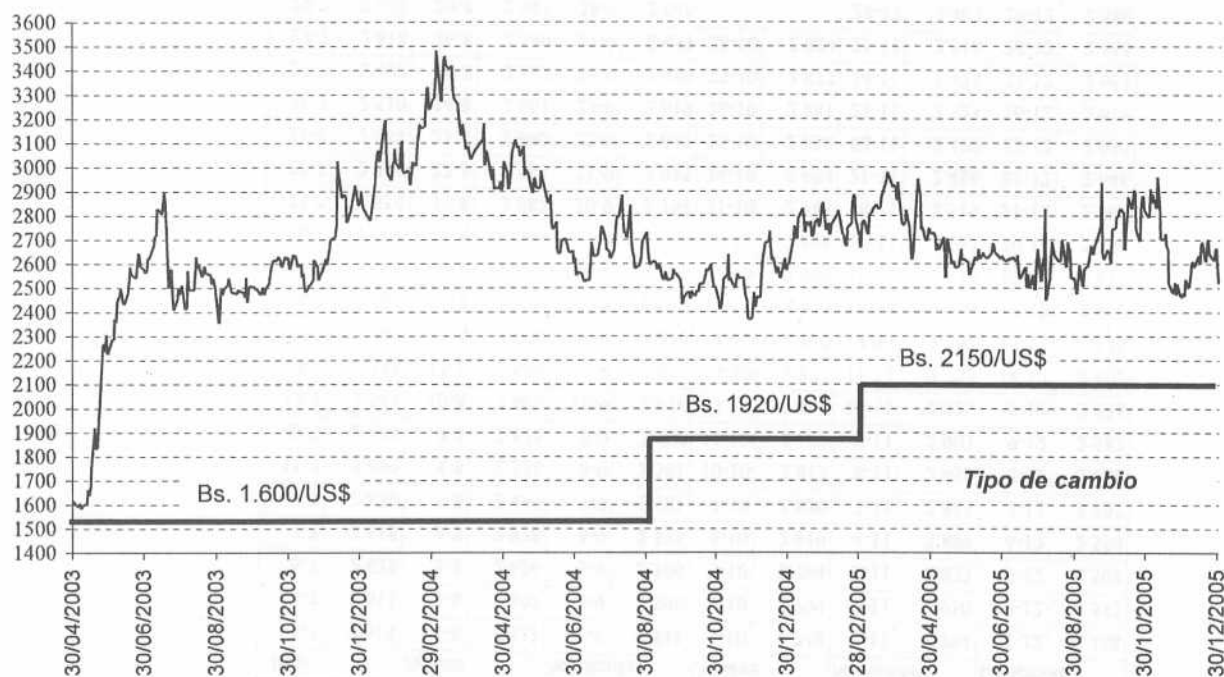
Tipo de cambio oficial vs dólar CANTV (referencia de mercado) -mayo 2003-diciembre 2005-

Un ADR de CANTV equivale a 7 acciones de la empresa. Para calcular el dólar CANTV, se debe tomar el precio de la acción en Caracas y multiplicarlo por 7, lo cual resultará en el valor del ADR en Bolívars. Al dividir este monto entre el costo del ADR en dólares, se obtiene la equivalencia del Bolívar frente al Dólar (Bs/$)