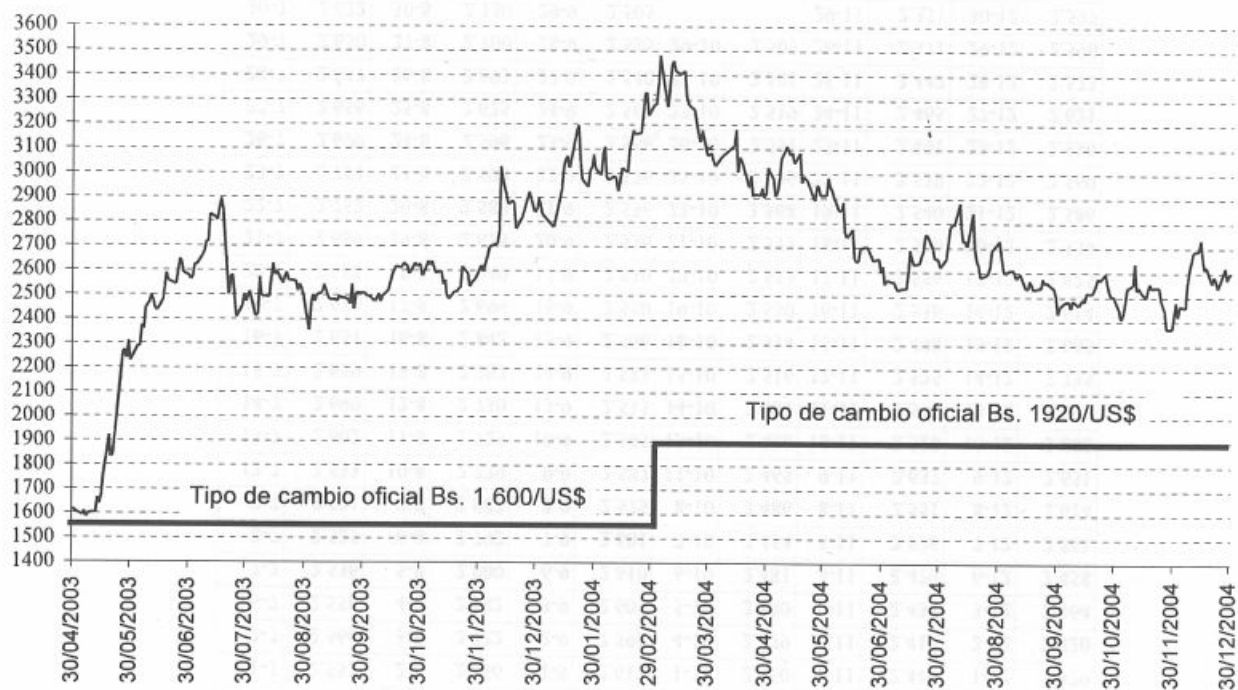
Tipo de cambio oficial vs dólar CANTV (referencia de mercado) -mayo 2003-diciembre 2004-

Un ADR de CANTV equivale a 7 acciones de la empresa. Para calcular el dólar CANTV, se debe tomar el precio de la acción en Caracas y multiplicarlo por 7, lo cual resultará en el valor del ADR en Bolívars. Al dividir este monto entre el costo del ADR en dólares, se obtiene la equivalencia del Bolívar frente al Dólar (Bs/$)