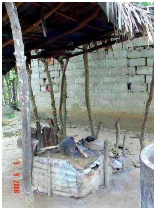
Ilustración 5: Cocina tradicional palenquera semejante a las africanas