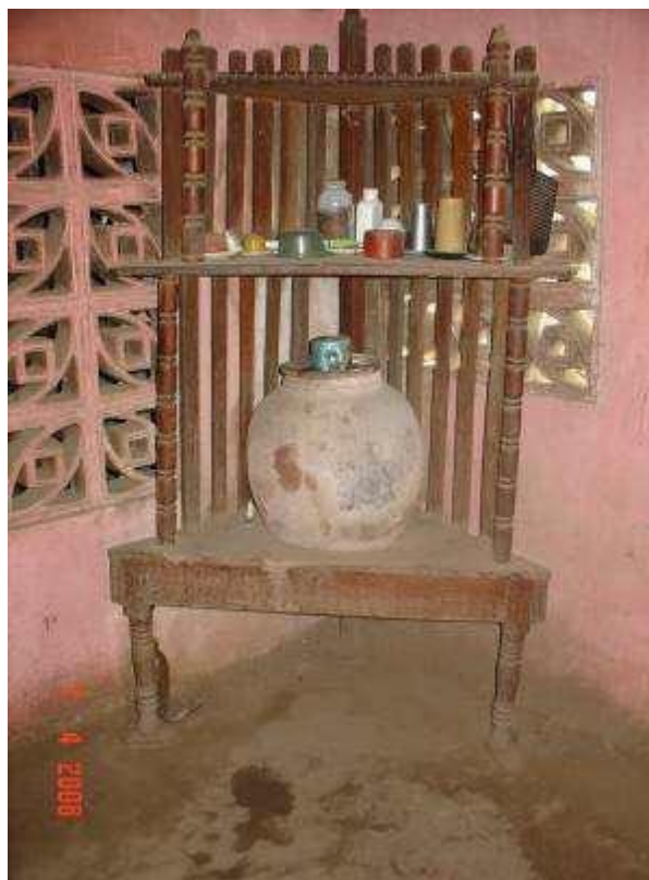
Ilustración 6: Tinaja de agua para guardar agua fresca como en África