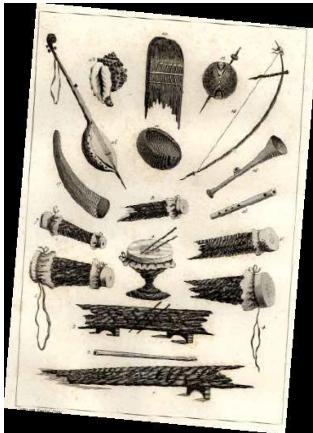
Ilustración 1: Muestra de instrumentos de música afroamericanos

Fuente: John, Gabriel Stedman, Voyage a Surinam et dans l'intérieur de la Guiane , Paris, Chez F. Buisson, 1799. Colección Libros Raros de la Biblioteca Nacional.