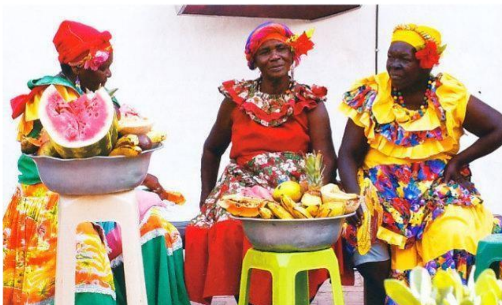
Ilustración 4: Vestido y colores palenqueras modelo africano

Fuente: Extracto de: Ronal Javier Miranda Márquez, “Ma muje ri palenge” la construcción de un símbolo cultural en Cartagena de Indias (1975 – 1985), Cartagena, Universidad de Cartagena, 2014, p92