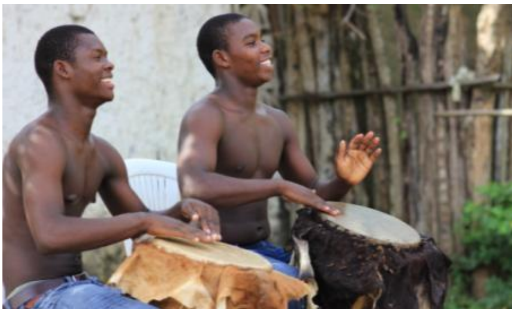
Ilustración 7: Jóvenes tocando el tambor