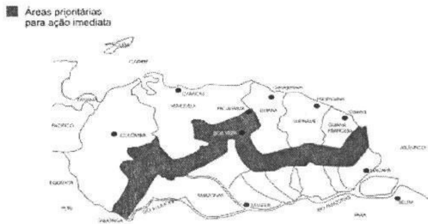
Figura 2 PROJETO CALHA NORTE

Aún, es importante destacar que el ámbito de la política de Seguridad Nacional, fue instituido el Proyecto Calha Norte, en 1985. Considerado como un proyecto de “Desarrollo y Seguridad Nacional” constituye una iniciativa de la política gubernamental, con la finalidad de la ocupación sistemática de áreas estratégicas al norte de los ríos Amazonas y Solimões (figura 2).