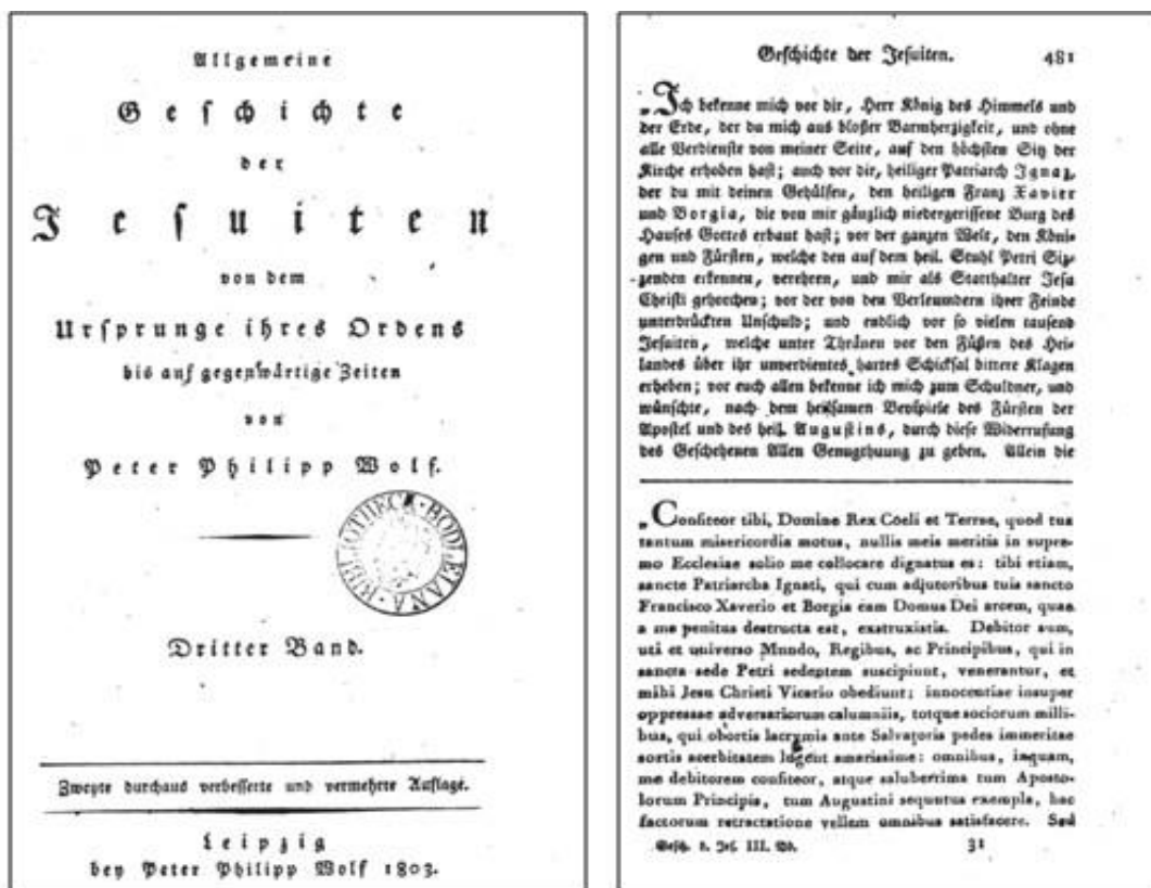
Portada y página donde comienza la transcripción de la Retracción en latín que hace Wolf en una edición de su libro de 1803.

Al desconfiado alemán siguieron otros escritores como Anche Liévin-Bonaventure Proyart 16 quien en 1800 también afirmó ser un documento falso. Aunque otros, como Jean-François Georgel dieron como real esta Retracción en su obra publicada en París siete años después 17 . También, otro escritor francés, Jacques-Maximilien Benjamin de Saint-Victor es categórico en afirmar en 1827 18 que la autenticidad está fuera de toda duda. Incluso la versión gala de 1889, señala que la Retracción fue publicada por el periódico “ O Católico ” de Braga en el número 2 del 10 de marzo de 1853. De tal modo que ese manuscrito “secreto” en realidad tenía una amplia difusión en Europa antes que los jesuitas lo hicieran público a través del P. Eugenio Labarta.