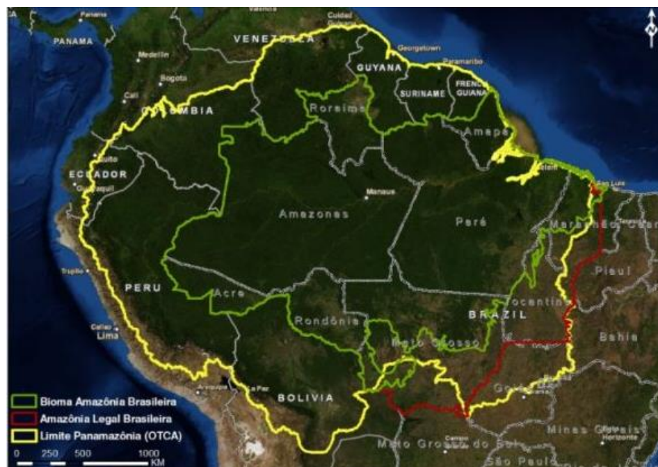
Figura 1: Región de la Pan-Amazonía

Ahí tenemos la Amazonía y fíjense donde está la UCAB Guayana, justamente en la Amazonía . En la parte norte, tenemos países como Surinam, Brasil, Colombia, Ecuador, Perú y Venezuela; en todos ellos hay instituciones de la Compañía de Jesús, pero insisto, la UCAB Guayana es la única que está en la Amazonía y esa respuesta de la universidad no puede ser simplemente desde una investigación, tiene que ser desde la docencia y desde la extensión, entendiendo que debe responder al lugar donde está ubicada.