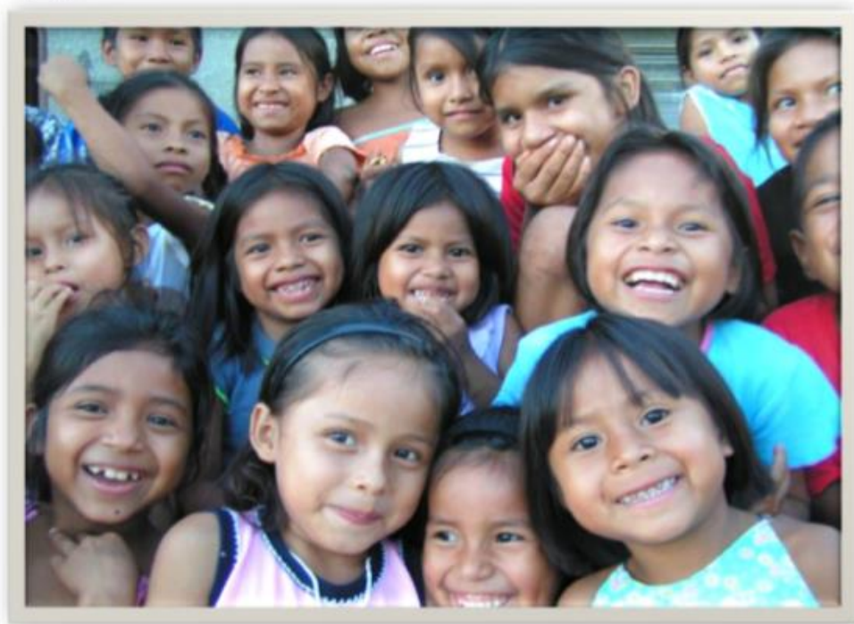
Figura 7: Foto de niños indígenas.

para el riego y la construyeron los estudiantes durante el semestre. Se trató de un trabajo voluntario porque fue hecha para otra comunidad y en la cátedra. Al final lo que les pido es que estemos juntos en esta misión y además desde la UCAB Guayana queremos seguir trabajando el tema de la Amazonía .