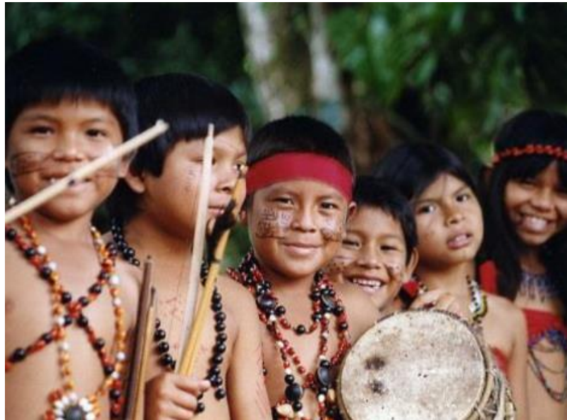
Figura 3: Fotos de indígenas miembros de la región Guayana

Para poder contextualizar, me atrevo a traer con mucho respeto algunos datos: a nivel mundial los indígenas son el 5% de la población, pero representan al mismo tiempo el 15% de la población pobre de todo el mundo, es decir, que, si estábamos diciendo que la Compañía de Jesús debe observar a los más excluidos, resulta que el indígena es una población bastante frágil, a la que tenemos que dedicar un importante trabajo. Otra de las cosas que es importante ver es que hay más de 400 grupos que tienen distintas lenguas y distintas culturas, entonces es un reto para aquellos que creemos que tenemos la verdad absoluta pero no hay una sola verdad, hay muchas cosmovisiones de esa verdad.