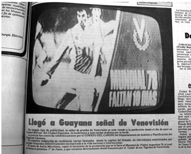
Figura 3: Portada del diario Correo del Caroní 02 de junio 1977.

Sin ningún tipo de publicidad, la señal de prueba de Venevisión se está viendo a la perfección desde el día de ayer en Ciudad Bolívar. En Ciudad Guayana, la tendremos a más tardar mañana por la tarde.