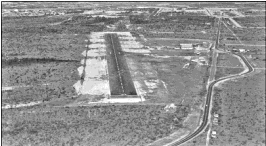
Imagen 5: En 1968 la Orinoco Mining C. transfirió a la nación el aeropuerto de Puerto Ordaz, además de 128 km de carretera que había construido para la explotación de mineral de hierro.