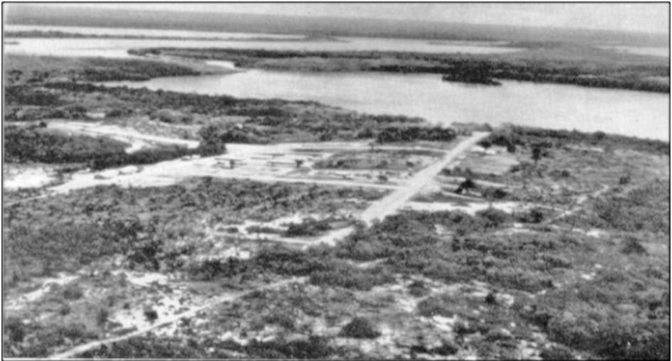
Imagen 1: Vista de una zona de Puerto Ordaz, escasamente poblada donde se establecieron las primeras "barracas" para trabajadores de la OMC (1952).