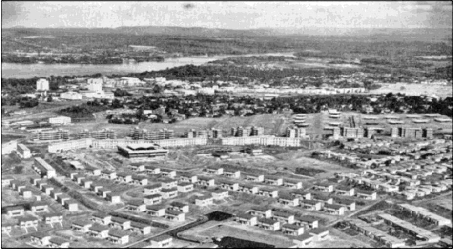
Imagen 3: Vista de viviendas residenciales construidas para los trabajadores por la OMC en Puerto Ordaz (1967).