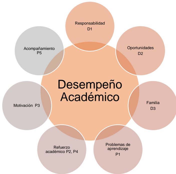
Figura 3. Gráfico de la categoría Desempeño académico y las subcategorías correspondientes.