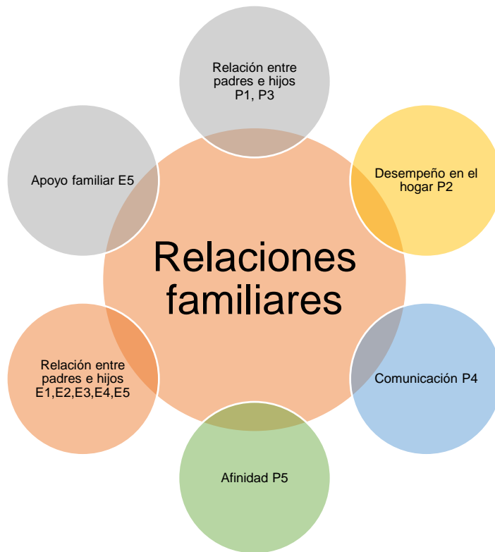
Figura 4. Gráfico de la categoría Relaciones familiares y las subcategorías correspondientes.

más atención de mi papá que yo”. En esta apreciación del estudiante, manifiesta la no atención de su padre hacia él/ella sino más bien hacia los otros hijos. En base a estas consideraciones Herrera (2018) dice que “la prioridad que se debe dar es a los niños y adolescentes que pasan a formar parte de esta nueva familia” (p.14). Es notorio que el cariño y la armonía debe darse en igualdad de condiciones a todos los miembros del nuevo hogar. Los niños sienten la diferenciación y esto puede influir en su desenvolvimiento tanto en el hogar como en la escuela. Las relaciones familiares son determinantes, en el gráfico 4 se detalla las subcategorías emergentes de la misma.