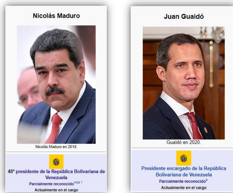
Figura 2. Plantillas de los artículos «Nicolás Maduro» y «Juan Guaidó»